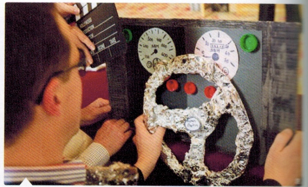
Réalisation d'effets pour un tournage par les Ateliers du Court-Métrage