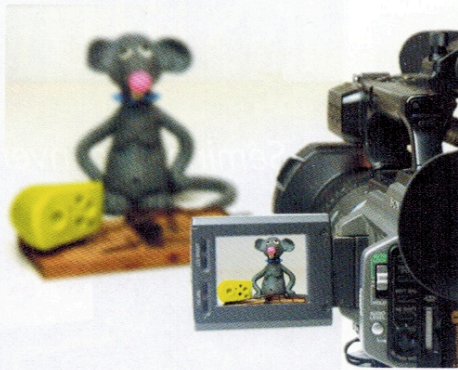
Cinévent propose l'animation pâte à modeler

« Silence, on tourne ! » marque le début du tournage du film ou du court-métrage, l'une des étapes de l'atelier cinéma précédant le montage et la projection. Précédemment, les participants auront découvert l'écriture d'un scénario, les techniques du 7 e art, avant de passer à la réalisation ( Ateliers du Court-Métrage, Azefir... ). Une animation qui rencontre toujours un succès auprès des entreprises qui peuvent y associer des messages et un contenu. Les coulisses du 7 e Art se vivent aussi à travers d'autres ateliers : doublage, bruitage ( For Event ), fabrication d'un film d'animation en créant des personnages en pâte à modeler, auxquels on va donner vie en 3 h ( Cinévent ), d'effets spéciaux pour réaliser une scène d'action sur un plateau de tournage (technique du fond vert) dans la tradition des films de studio avec conception de la bande-annonce. Ou encore immersion dans l'univers des cascadeurs des films d'action et d'aventure à travers l'activité Freejump . L'acteur Tomer Sisley et son équipe de professionnels réalisent des démonstrations de sauts et enseignent les techniques pour ensuite s'y essayer. Une activité pour dépasser ses limites et se faire confiance.